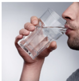
Nodig bij lichaamsprocessen