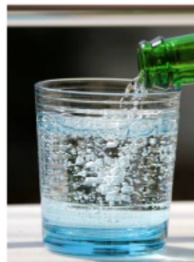
Bubbels in dranken