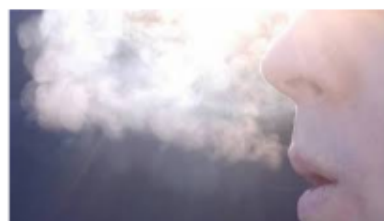
In uitgeademde lucht